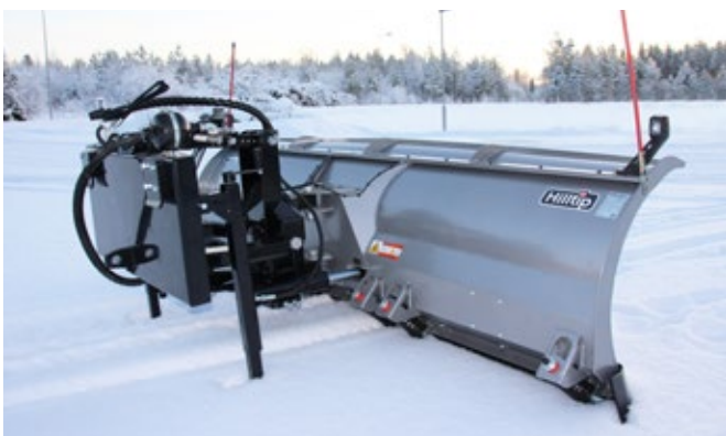
Dispositivo de elevación en paralelo para camiones y máquinas con placa DIN