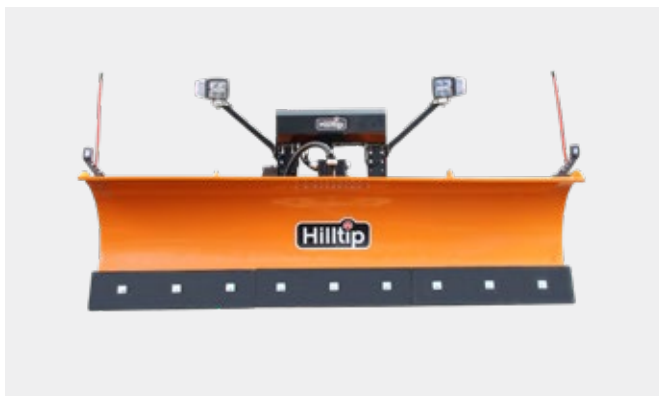
Quitanieves naranja SML con torre de iluminación, opcional