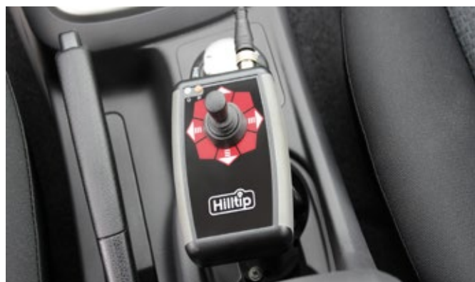
Palanca de mando (solo en modelo electrohidráulico)