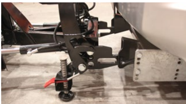
Enganche rápido: levante el asa de la zapata para fijar su pala quitanieves al vehículo.