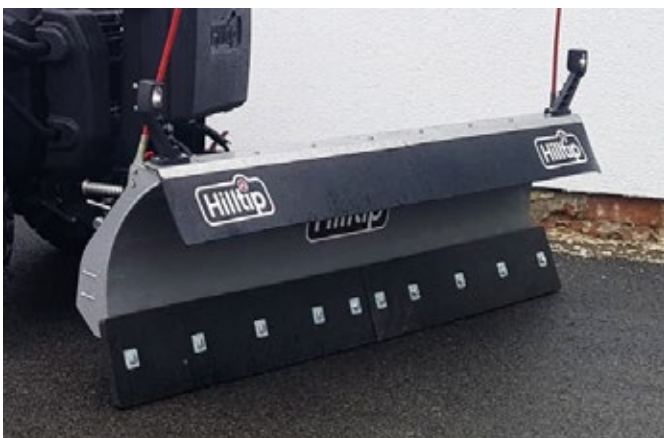
Deflector de nieve de polietileno opcional