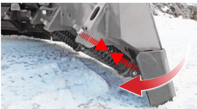
Rascadora con muelles de desplazamiento