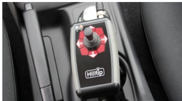
Palanca de mando