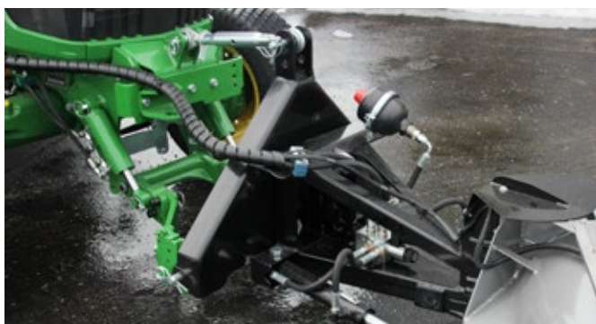
Enganche de 3 puntos para tractores