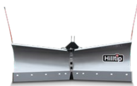
Pala en V para tractor