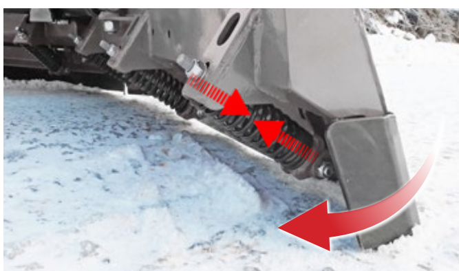
Rascadora con muelles de desplazamiento