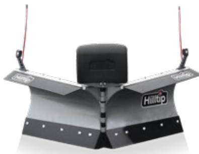
Pala en V para UTV