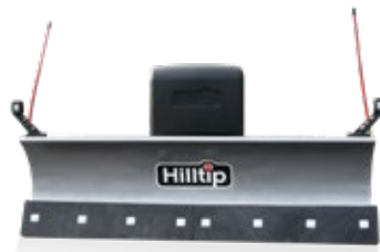
Cuchilla recta pala quitanieves para UTV