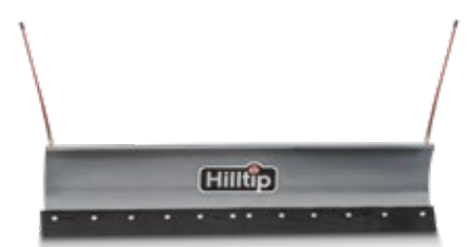
Cuchilla recta pala quitanieves para tractor