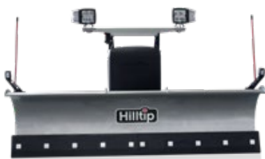
Cuchilla recta pala quitanieves para pick up

La cuchilla curvada, con recubrimiento de polvo está hecha de acero de alta resistencia que, en este caso, es la clave de nuestra pala quitanieves duradera pero ligera. Dos rascadoras segmentados con muelles de desplazamiento protegen la pala quitanieves y el vehículo de impactos al golpear obstáculos. La rascadora está disponible en poliuretano o en acero de alta resistencia.