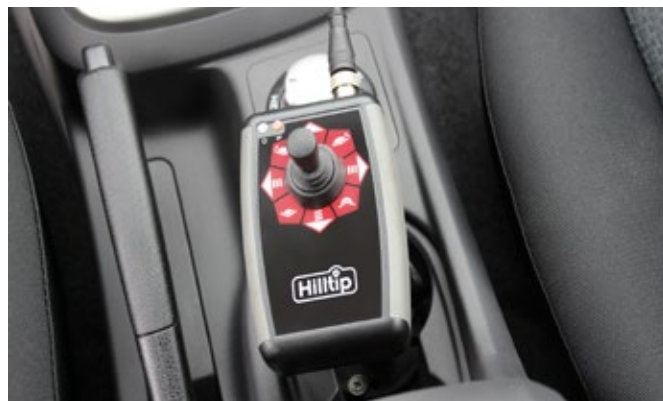
Palanca de mando