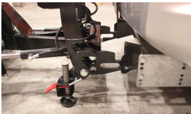
Enganche rápido: levante el asa de la zapata para fijar su pala quitanieves al vehículo.