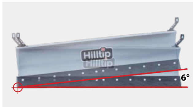
Ángulo de inclinación de 6°