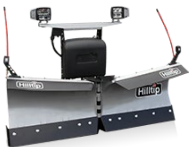
Pala en V para pick up

La cuchilla curvada, con recubrimiento de polvo está hecha de acero de alta resistencia que, en este caso, es la clave de nuestra pala quitanieves duradera pero ligera. Dos rascadoras segmentados con muelles de desplazamiento protegen la pala quitanieves y el vehículo de impactos al golpear obstáculos. La rascadora está disponible en poliuretano o en acero de alta resistencia.