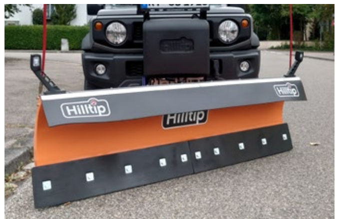
Cuchilla recta en el color opcional naranja